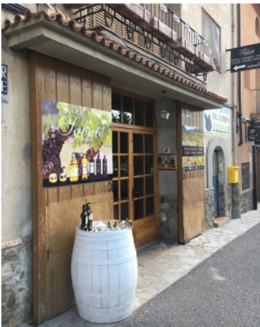
La Vilella Baixa i vinområdet Priorat. Herover, vinhuset som vi besøger. Til højre, udsigt over landsbyen.