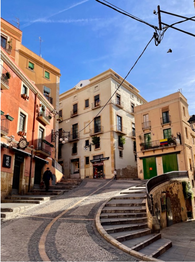
Fra den gamle bydel

Tarragona og omegn. Tarragona er hovedstad i provinsen af samme navn. Den har ca. 140.000 indbyggere, så det er en mindre by efter spanske forhold. I romertiden hed den Tarraco og var en af de vigtigste byer i hele Romerriget, og i dag er der masser af rester fra dengang at se. Der er også en meget charmerende gammel bydel med smalle, bilfrie gader og en smuk, gotisk katedral. I den nyere del af byen finder man brede boulevarder, butiksstrøg og et stort madmarked, alt sammen iblandet et charmerende romersk islæt i form af spredte ruiner der dukker op hist og her. Tarragona ligger smukt ud til Middelhavet, ca. en times kørsel syd for Barcelona, men den er ikke nær så besøgt af turister som den catalanske hovedstad. Der er dejlige strande tæt på byen, og det er nemt at komme til hyggelige kystbyer både nord og syd for Tarragona.