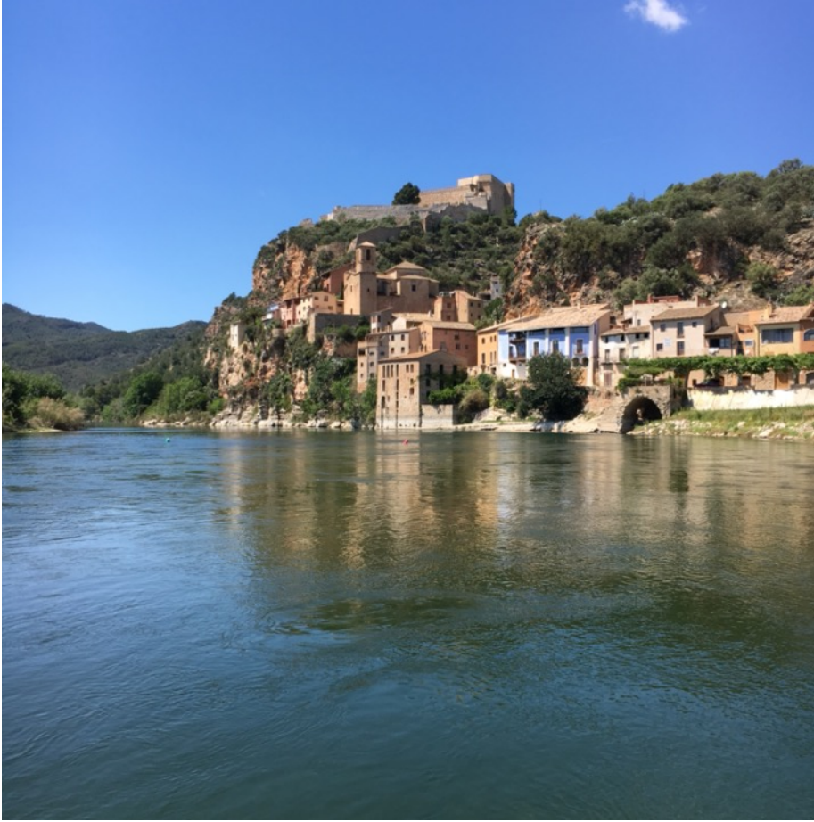
Miravet ved Ebro-flodens bred

Ud at se. Vi skal selvfølgelig udforske Tarragonas romerske historie, med en guide som hjælper os med at tolke hvad vi ser. Et par dage tager vi på tur i lejet bus til nogle af de spændende steder i omegnen. Vi tager til vinområdet Priorat , hvor vi skal besøge et lille, familiedrevet vinhus, se smukke landskaber og køre op til den lille landsby Siurana, med en vanvittig flot beliggenhed på et klippeplateau. En anden dag tager vi til Miravet , en smuk landsby med en spændende historie og en pragtfuld beliggenhed ved