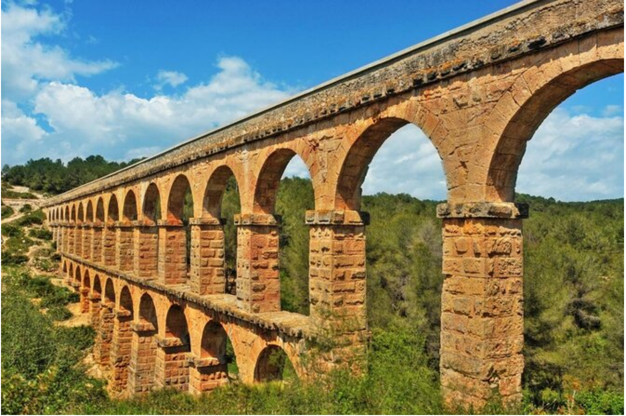
Pont del Diable, akvædukt fra romertiden. Her kan vi komme til med bybussen fra Tarragona