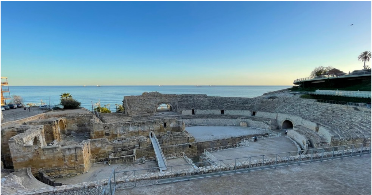
Det romerske amfiteater, i skumringen

Vi skal tilbringe knap en uge i den charmerende provinshovedstad Tarragona, hvor vi skal tale og høre en masse spansk og opdage en del af Catalonien som ikke mange danskere kender.