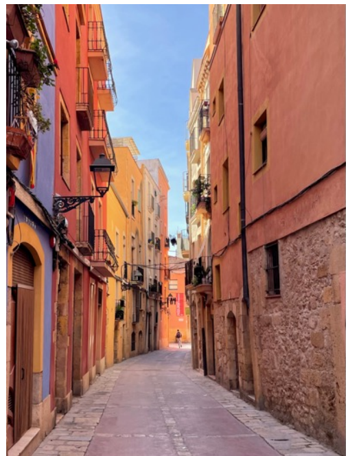
Tarragonas gamle bydel

Tosprogethed er en realitet i store dele af Spanien, og dette kursus er en mulighed for at opleve det på nært hold og måske få aflivet nogle fordomme om catalansk og catalanere.