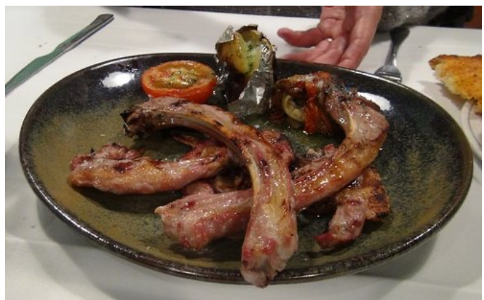
Cordero a la brasa, grillet lam

Ud at spise. I Catalonien spiser man rigtig godt. Kød og grøntsager grillet over ildstedet fylder meget i den lokale madtradition, så det kommer vi helt sikkert til at prøve. Der er også et rigt udvalg af fisk og andet godt fra havet, helt som man vil forvente det af en by som ligger ved Middelhavet. Hvis du mest er vant til at rejse i det sydlige Spanien, skal du være forberedt på at prisniveauet i Catalonien er højere end sydpå. Det er dog stadig billigere at gå ud at spise her end i Danmark.