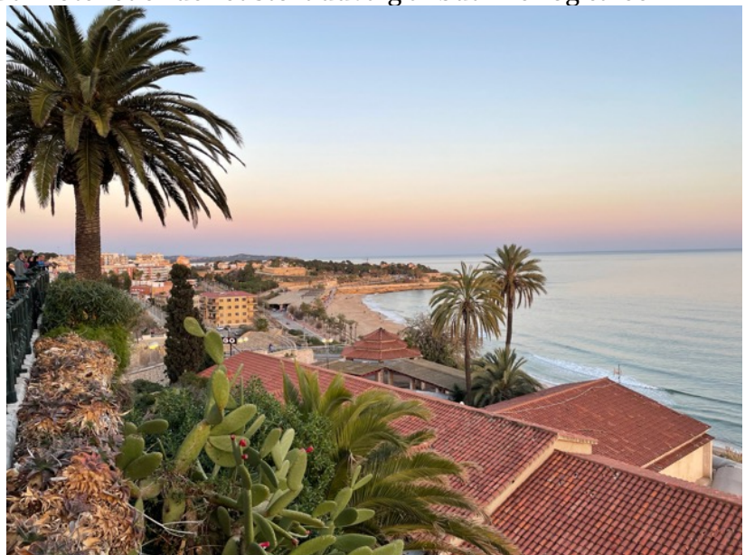
Udsigten fra Balcón del Mediterráneo