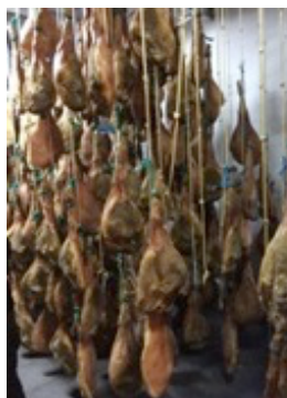
Skinker i Trevélez