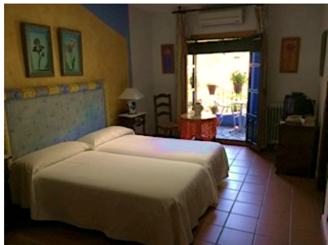
Værelse på Hotel Mecina

Kursus 1 foregår i den lille landsby Mecina i Alpujarra-bjergene. Her er vi væk fra de slagne turistruter, i smuk, frodig natur som indbyder til dejlige gåture, både lette spadsereture og længere, mere krævende vandreruter. Mecina er meget lille og meget fredelig. De dominerende lyde er fuglesang og det rislende vand fra byens gamle vandposter. Her er ingen butikker, men til gengæld tre gode og meget forskellige spisesteder. I den nærliggende by Pitres finder man et lille supermarked, apotek og flere barer og restauranter.