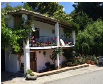
Hus nær Mecina

Spanskundervisningen på begge kurser har uformel karakter, hvor deltagerne sidder i små grupper ved samme bord. Der er undervisning på alle niveauer, dog skal du minimum have gennemført Niveau 1 hos det Spanske Hus eller tilsvarende et andet sted for at kunne deltage i undervisningen på rejsen. Deltagerne bliver inddelt i hold efter niveau og sidder i en lille gruppe som veksler imellem forberedelse i gruppen og undervisning med lærer. Vi er to undervisere: mig selv og en lokal, indfødt lærer. Den indfødte lærer vil undervise holdet på avanceret niveau. Der er 16 lektioner spansk à 45 minutter pr. uge.