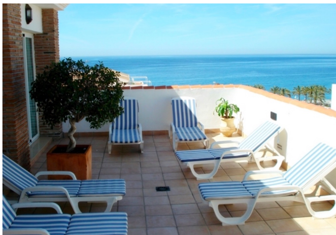
Hotel Almijara, en del af tagterrassen

Kursus 2 foregår i La Herradura , som er en fredelig badeby i provinsen Granada. Her har mange spaniere og udlændinge deres feriebolig, men der er få hoteller og ingen masseturisme. Byen ligger idyllisk ved en pragtfuld bugt med en lang badestrand. I de umiddelbare omgivelser er der plantager af avokado og mango og et stort naturområde omkring forbjerget Cerro Gordo, hvor der er gode muligheder for vandreture. De hyggelige feriebyer Almuñécar og Nerja kan nemt nås med lokalbus.