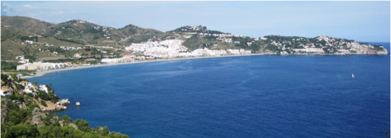
Udsigt over La Herradura

To spanskkurser i forlængelse af hinanden, på to vidt forskellige og lige pragtfulde steder i Andalusien. Tag en uge eller to med intensiv spanskundervisning, kultur- og naturoplevelser, socialt samvær og god, lokal mad. Deltagerantallet er begrænset til 16 på hvert kursus.